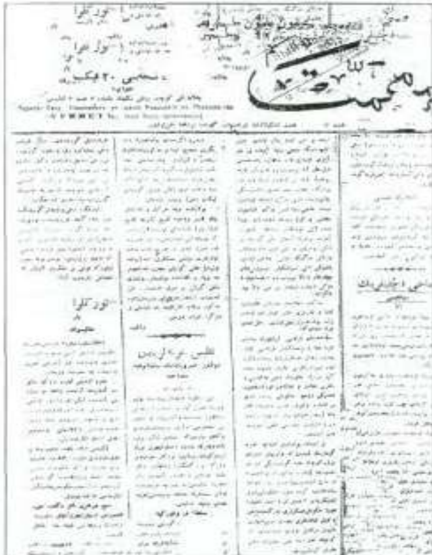
"Hürriyet" gazetesinde darc olumun Şamcaı kaçınıklarının bir grupuna sızışın