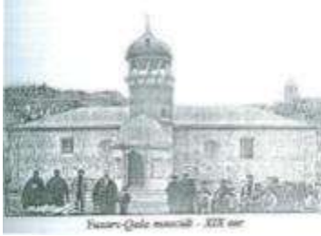
Şamaxı-Qala məscidi - XIX əsr

Haşiyə: vaxtilə Şamaxının iyirmi altı məhəlləsi (bəzi mənbələrdə 32 məhəllə) olmuşdur. Bu məhəllələrin bir neçəsində qeyri-müsəlmanlar yaşayırdılar.