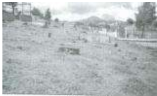
Şamaxıda (Şəhər) qayıdanda.