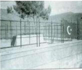
Şəhid türk zabiti - İzzət Əfəndinin məzarı (2000)

Bu qəbir osmanlı alayı qoşunlarından olan zabitin qəbridir. Qafqaza gəldi, müharibə etdi və şəhid oldu. 1336 (1918)-ci ildə şərəfli şəhadətli daddı, ilqarını seçdi.