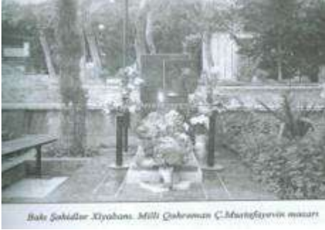
Bakı Şəhidlər Xiyabanı. Milli Qəhrəman Ç. Mustafayevlə məzarı