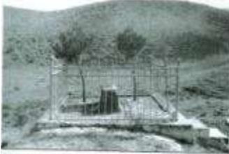
Şəhid türk zabiti - İzzət Əfəndinin məzarı (1990)

Bir türk oğlu qəhrəmanındır bu məzar, Gör necə yer ilə yeksan eyləmişdim xazikar. Qafqaz islam yolunda eyləyib zinhar canın, Ərseyi-hərb içrə bir əslanıdır bu məzar!