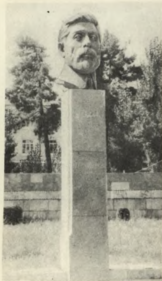
Памятник М. Азизбекову в г. Степанакерте