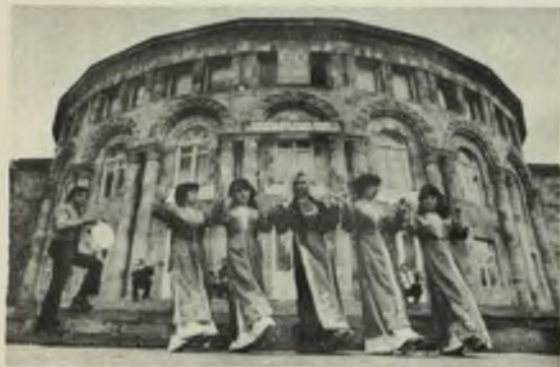
Самодельный народный ансамбль песни и танца «Кнар» Дома культуры Мартунинского р-на