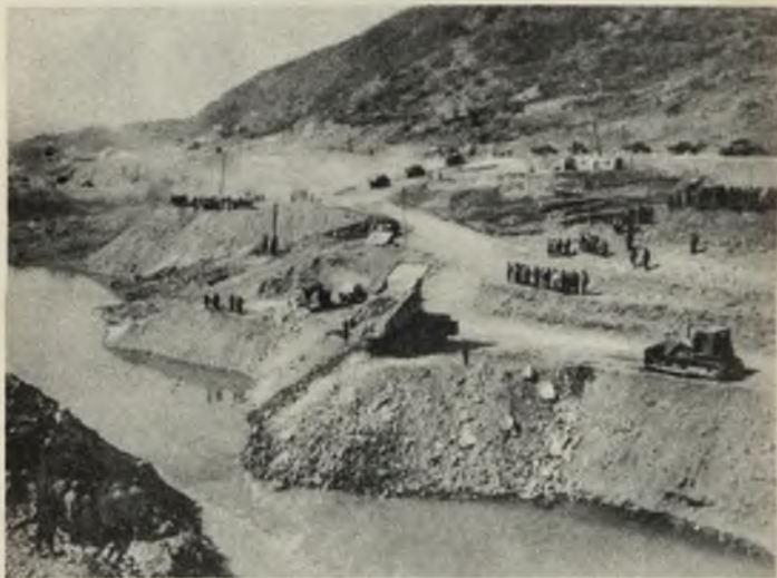
Перекрытие русла реки Тертерчай на строительстве Тертерской ГЭС