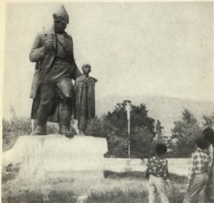
Памятник воинам-героям XI Армии в г. Степанакерте