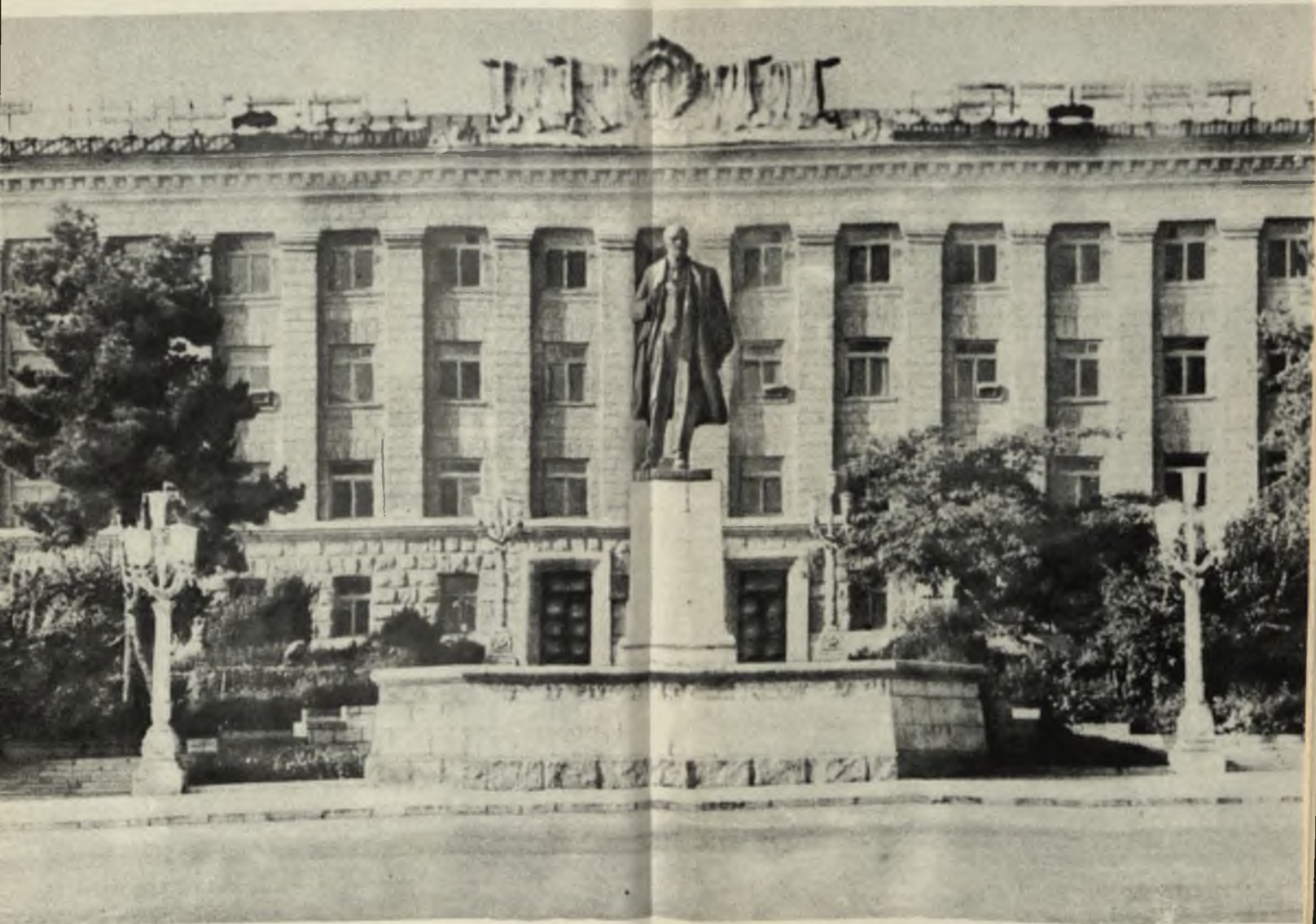
Площадь Ленина в г. Степанакерте