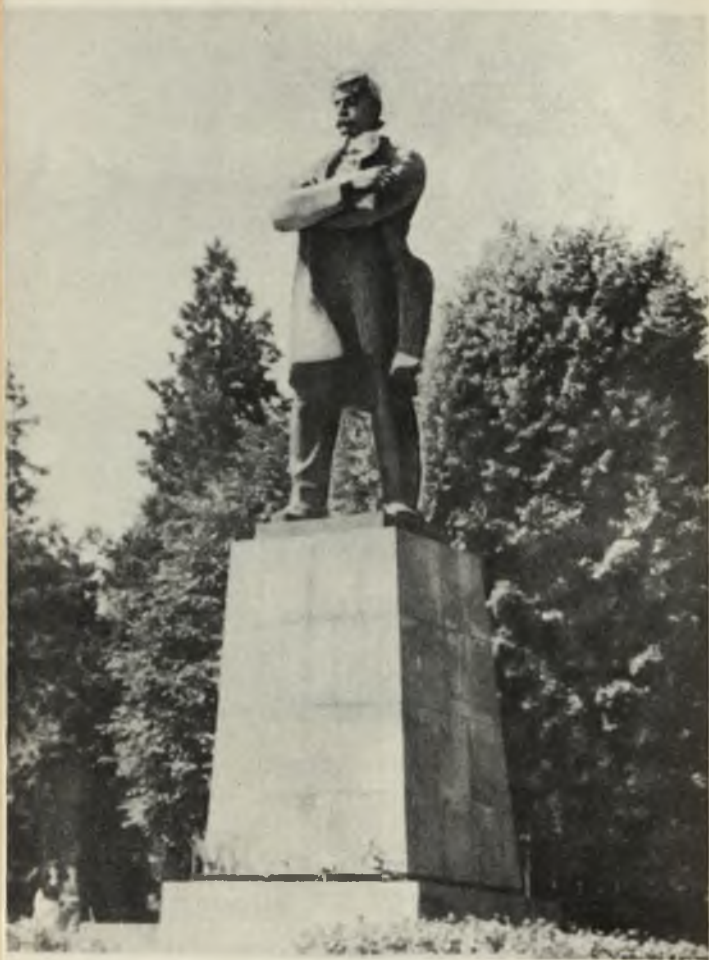
Памятник С. Шамяну в г. Степанакерте