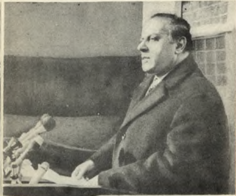
Г. А. Алиев на открытии Сарсангской ГЭС