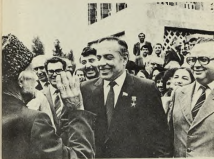
Открытие мемориала Вагифа в Шуше. Г. А. Алиев встречается с трудящимися города.

Установление Советской власти в Нагорном Карабахе — точка отсчета развития социалистической культуры края, достигнутой на основе прогрессивных традиций, интенсивного обмена духовными ценностями. Большой популярностью у трудящихся области пользуется Степанакертский ордена «Знак Почета» государственный драматический театр им. М. Горького, недавно торжественно отметивший свое пятидесятилетие. Один из старейших и ведущих художественных коллективов в Азербайджане успешно пропагандирует произведения многонациональной советской драматургии,