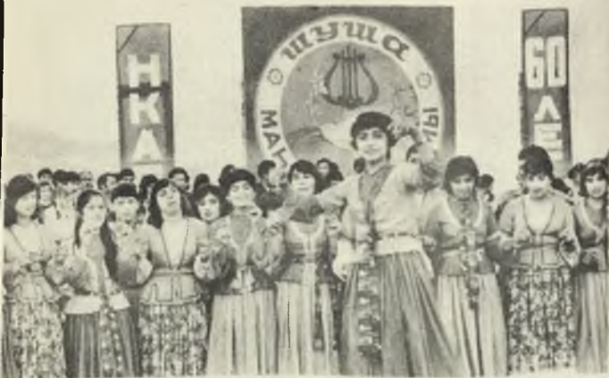
Праздник песни (г. Шуша)