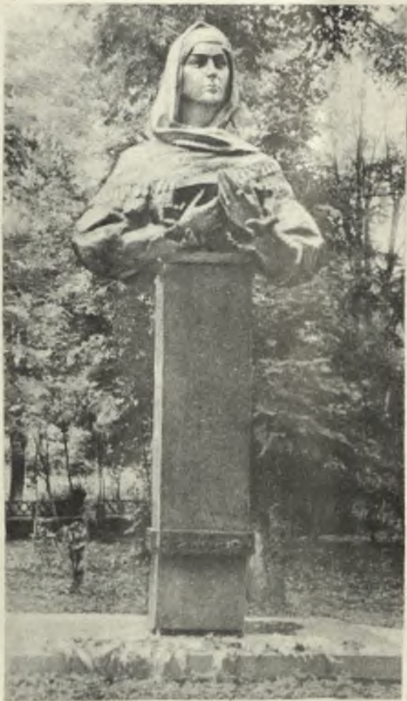
Азербайджанская поэтесса Натаван Хуршуд-балу.

способствуя воспитанию грядущих в духе интернационализма, братской дружбы народов СССР, верности коммунистическим идеалам. «Лучшие спектакли... театра, — отметил первый секретарь ЦК КП Азербайджана тов. К. М. Багиров на торжественном вечере, посвященном 50-летию театра, — отличаются глубиной постижения жизни и стремление во всей полноте, сложности и достоверности отразить ее на сцене, правда характеров, яркая образность, верность идеям советского патриотизма и социалистического интернационализма» 1 .