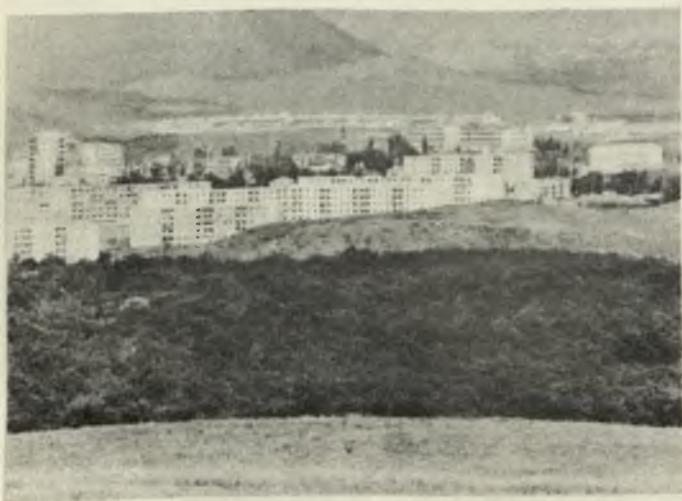
Степанакерт. Новые кварталы жилых домов