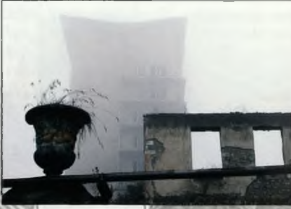
Erməni separatçıları tərəfindən dağıdılmış Azərbaycanın tarix və mədəniyyət abidələri