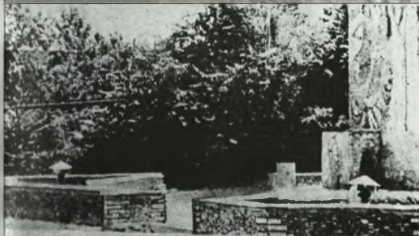
“150 il” abidəsi erməni separatçıları tərəfindən dağıdıldıqdan sonra. Ağdərə. 1988