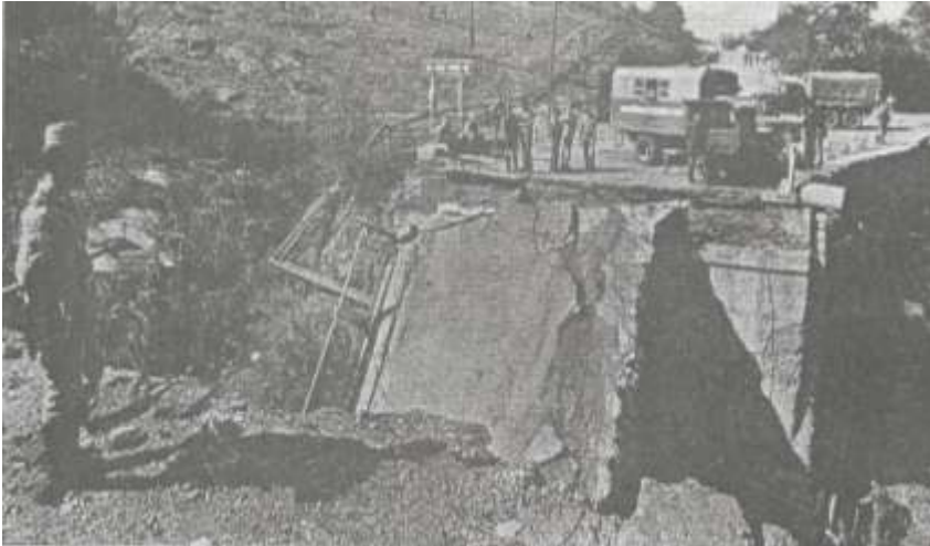
Daşnak terrorçuları tərəfindən Şuşa-Ağdam magistralında partladılmış Ağa körpüsü (30.11.1990)