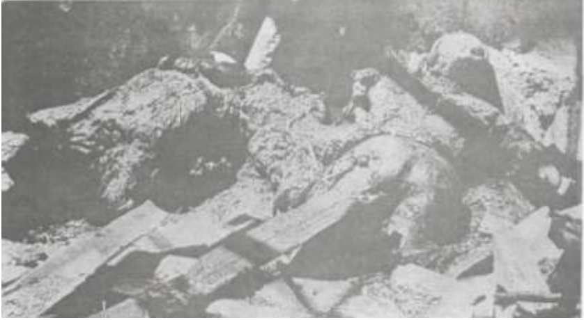
Daşnak terrorçuları tərəfindən Qaradağlı kəndinin fermasında qətlə yetirilib yandırılan malabaxanların cəsədləri (28.06.1991)