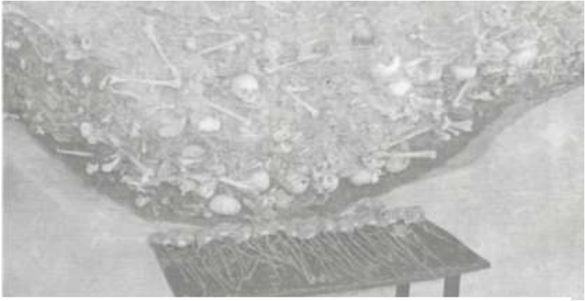
Erməni-daşnak faşistlərinin 1918-ci ildə Qubada törətdikləri azərbaycanlıların soyqırımına əks etdirən canlı xəritə muzeyi