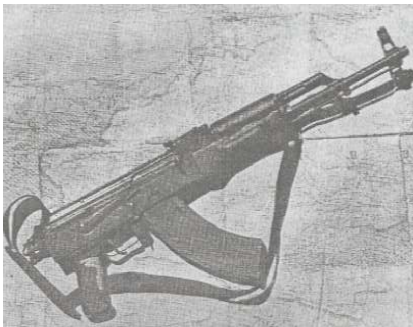
Erməni məktəblərində tədris edilən saxta "böyük Ermənistan" xəritəsi