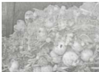
Qubada aşkar edilmiş toplu məzarlar (may 1918-ci il Quba qətləmi)