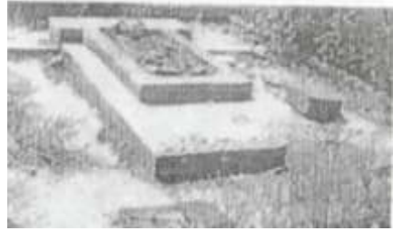
Erməni-daşnak faşistlərinin qurbanına çevrilmiş Ağadədə qəbiristanlığı (1988-ci il)